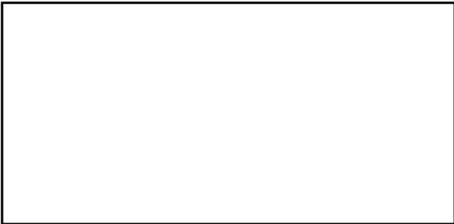
รูปที่ ๑ ชื่อเรือ / เลขทะเบียนเรือ