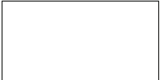
รูปที่ ๔ จุดที่จะขอติดตั้งอุปกรณ์ระบบ AIS

ข้าพเจ้าขอรับรองว่าข้อความในแบบคำขอที่ยื่นมานี้มีความถูกต้องและเป็นจริงทุกประการ ตลอดจนจะปฏิบัติตามกฎหมายและระเบียบของทางราชการทุกประการ และเมื่อได้รับการติดตั้งอุปกรณ์และระบบมาตรวัดจากกรมสรรพสามิตแล้ว ข้าพเจ้าจะดูแลรักษาอุปกรณ์และระบบมาตรวัดดังกล่าวเป็นอย่างดี ในกรณีที่อุปกรณ์และระบบมาตรวัดดังกล่าวชำรุดเสียหายอันเกิดจากกรณีที่เจ้าของเรือ ผู้ควบคุมเรือ ผู้ที่ปฏิบัติงานบนเรือ หรือบุคคลภายนอก กระทำโดยเจตนาทำให้เสียหาย ทำลาย ทำให้เสื่อมค่า หรือทำให้ไร้ประโยชน์ ข้าพเจ้ายินยอมชดเชยค่าเสียหายและค่าใช้จ่ายในการซ่อมแซมอุปกรณ์ให้แก่กรมสรรพสามิต